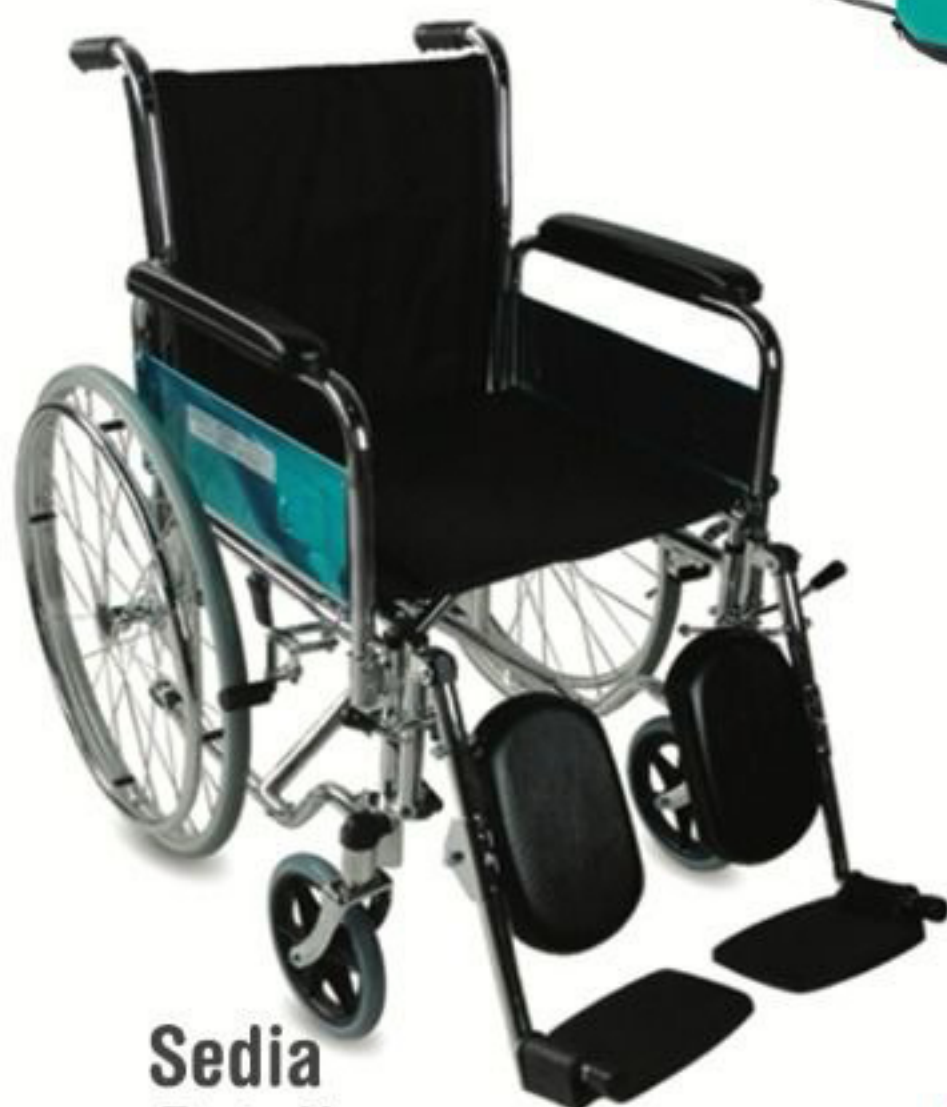
Sedia a Rotelle